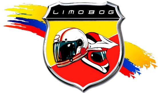
Liga de Motociclismo de Bogotá