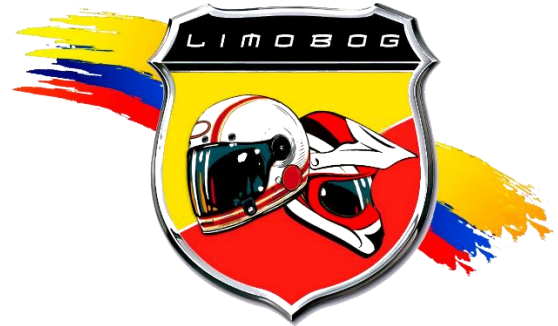
Liga de Motociclismo de Bogotá